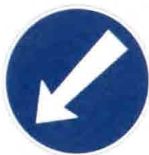
C4b Příkazáný směr objíždění vlevo