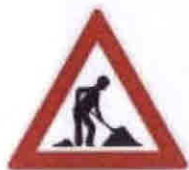
A15 Práce na silnici